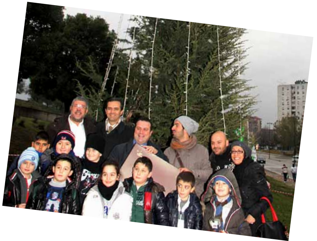
Davanti all'Albero della Legalità a Scampia