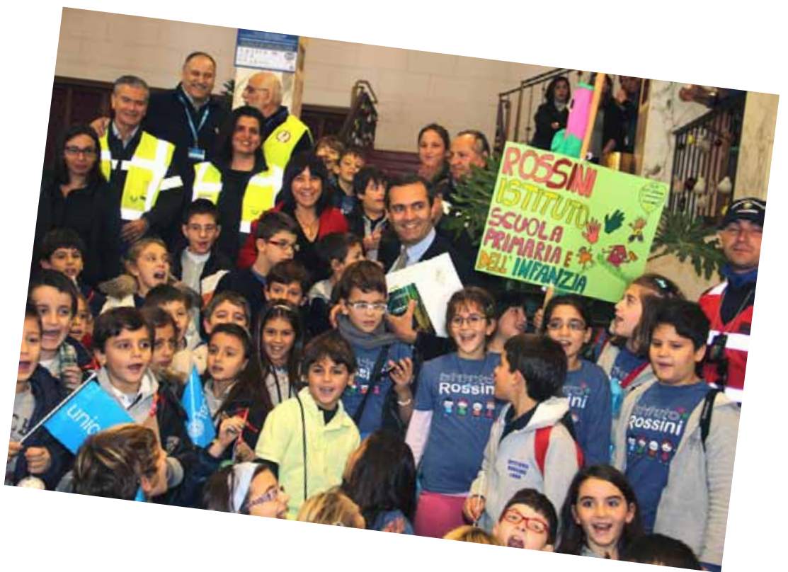
Alla Giornata Unicef per i diritti dell'infanzia e dell'adolescenza