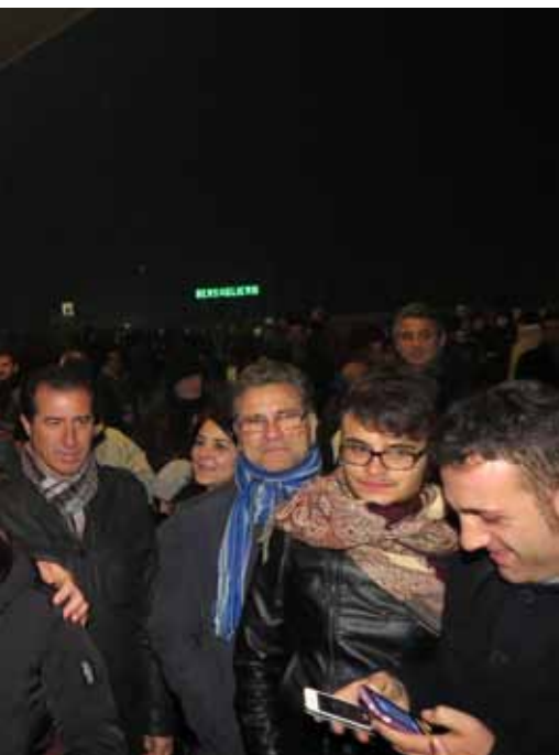
13 sul Lungomare