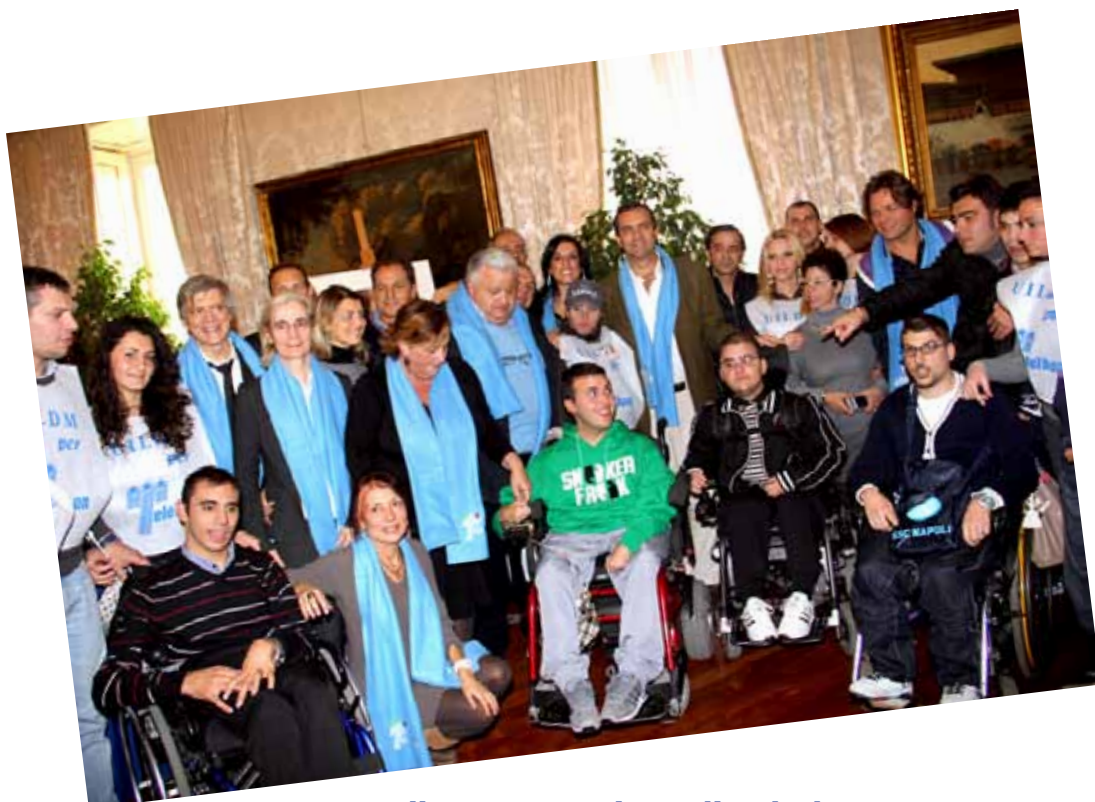
Alla presentazione di Telethon 2012