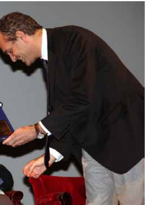
La festa dei suoi 90 anni