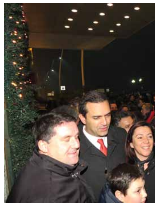
A Capodanno 20