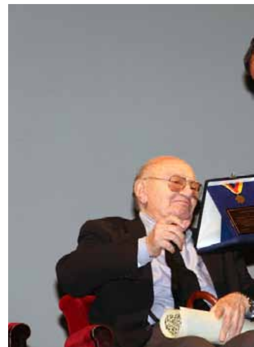
Con Francesco Rosi alla