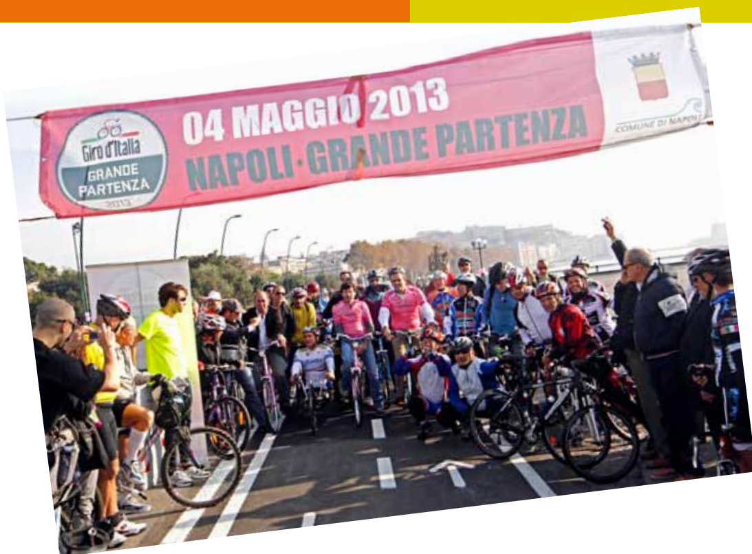
Con Gianni Bugno e Alex Zanardi sulla pista ciclabile del Lungomare