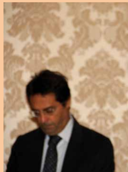
In Sala Giunta duran in memoria di P