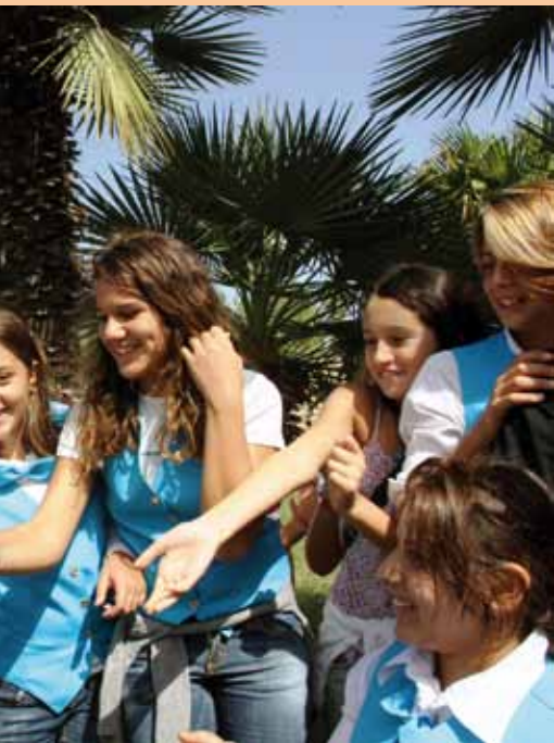
nell'anno scolastico nale di Scampia