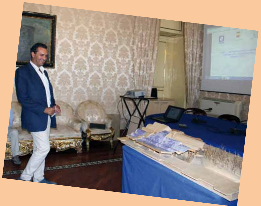
Con il plastico del progetto sul prolungamento della Linea 1 Centro Direzionale Capodichino