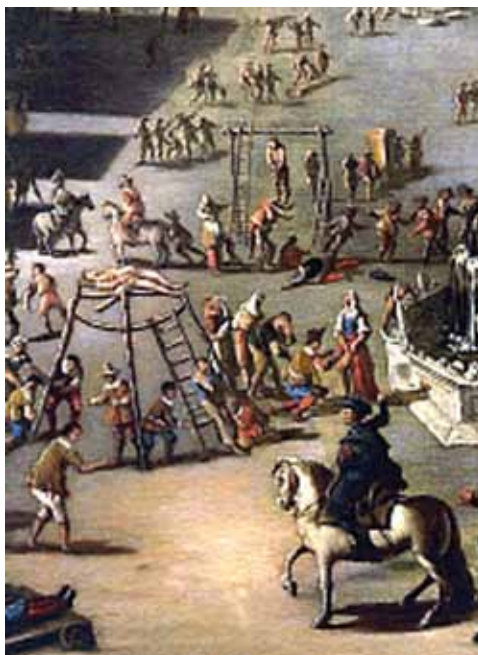
Sotto: particolare da Carlo Coppola, Piazza Mercato al tempo della peste del 1656, XVII secolo, Certosa e Museo di San Martino. Visibili la ruota e la forca

te eloquenza forense dimostrando, anche con citazioni dalle Sacre Scritture , come fosse stato superato qualsiasi limite nell'esercizio dell'incarico di carnefice.