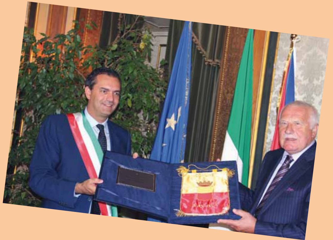
Con il Presidente della Repubblica Ceca, Vaclav Klaus