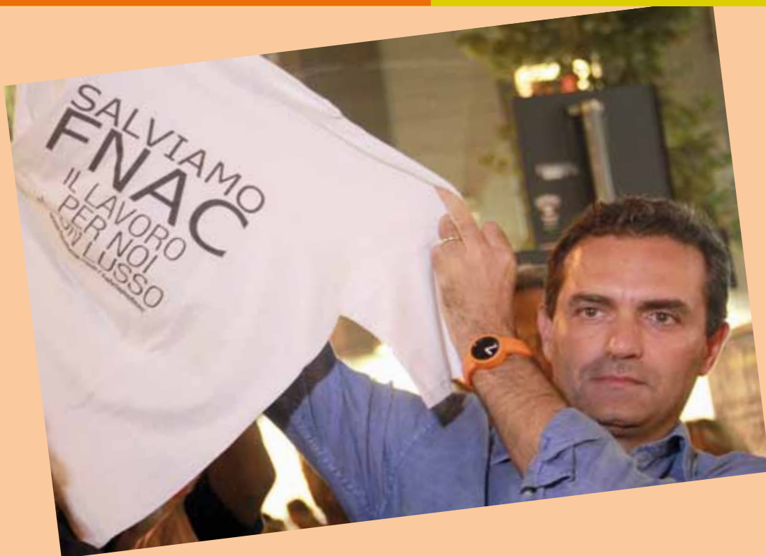
A sostegno dei lavoratori della Fnac durante la Notte Bianca al Vomero