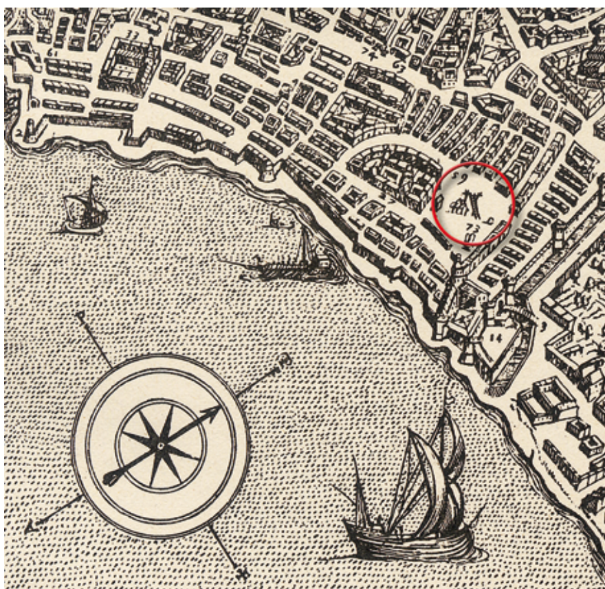
Particolare da una pianta seicentesca di Napoli. In evidenza la forca allestita stabilmente nella piazza del Mercato

In città si era fatto un nome, e non solo tra gli habitué di questo genere di cruento spettacolo. Il suo comparire per le vie nelle vesti di mastro Impicca era sicuro annuncio di qualche visione raccapricciante: il cadavere di un reo trascina-