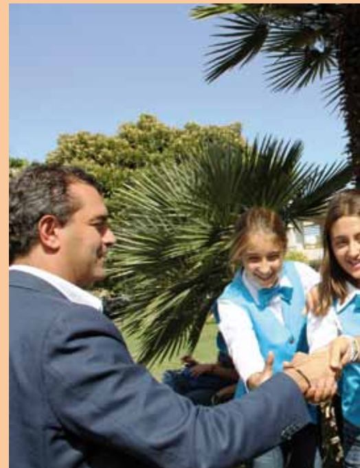
All'inaugurazione d nella villa comun